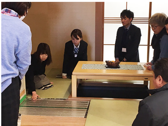
◎寒いこの季節、床暖房のやわらかい暖かさに、 みなさま興味津々です。