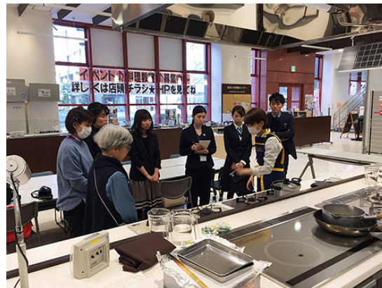
◎ガスコンロの近くまで来て頂き、機能性等のご紹介 をさせて頂きました