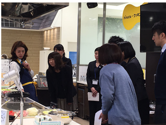
◎グリルの中等、細かい部分まで近くでご覧頂き、 納得のご様子。