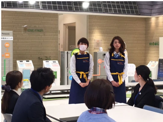
◎九州コラボからご挨拶の後、ヒナタスタッフ からもご挨拶。

はじめに簡単なご挨拶をさせて頂き、IHとガスコンロの比較実演を間近でご覧頂きました。後は、2班に分かれて館内 ツアースタート。ガスの様々なあたたかさや機能性をご体感頂きました。